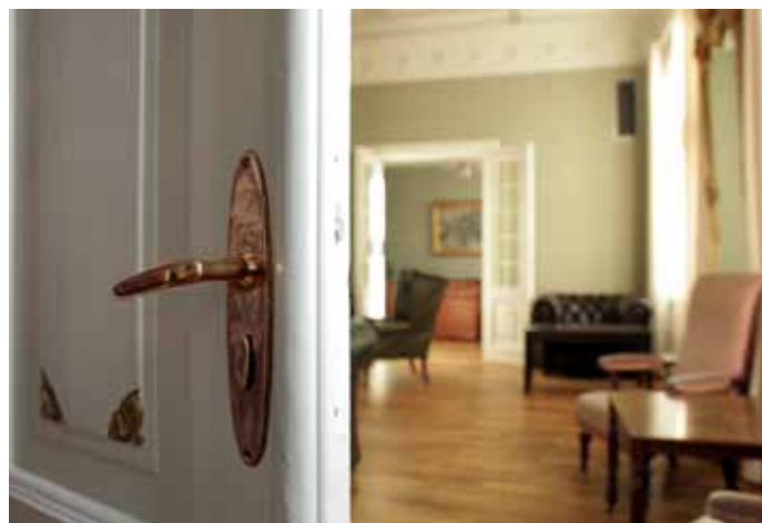
Original jugendvrider i bronse med ovalt langskilt. Supplert fra Hveding, KLN Søgne, med langskilt.