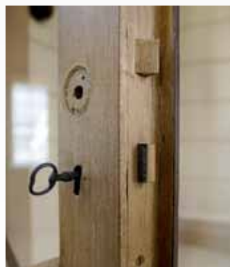
Original låskasse overhelt og så god som ny. Maler har malt over frontstolpe (teknikken heter ådring), en vanlig teknikk for la litt billig treverk , for eksempel å la gran og furu se ut som for eksempel eik.