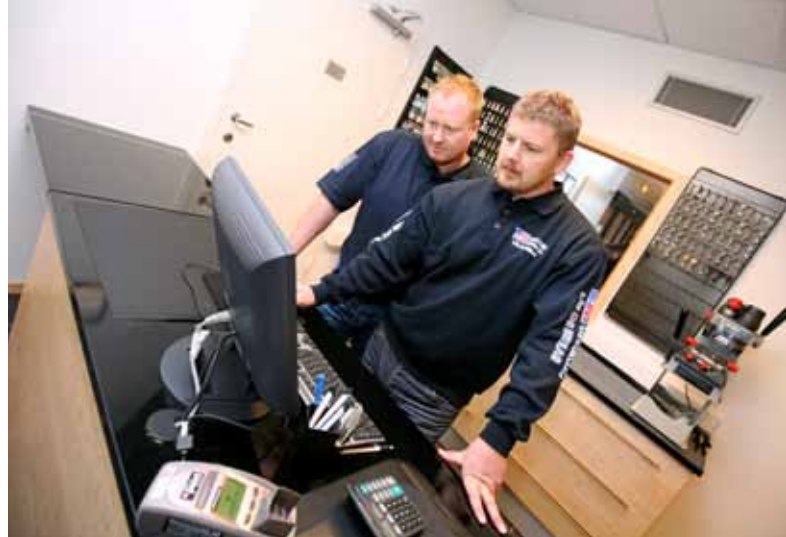
Foreløpig har Hagen og Gundersen ikke satset så mye på butikken, men det kommer.